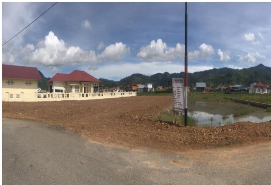
Foto Tanah Loka POM di Kabupaten Aceh Tengah

Jumlah Sumber Daya Manusia (SDM) yang dimiliki saat ini adalah 15 PNS dan 8 Pegawai Pemerintah Non Pegawai Negeri (PPNPN). Profil dan kualifikasi SDM pegawai Loka POM di Kabupaten Aceh Tengah dapat dilihat pada tabel di bawah ini: